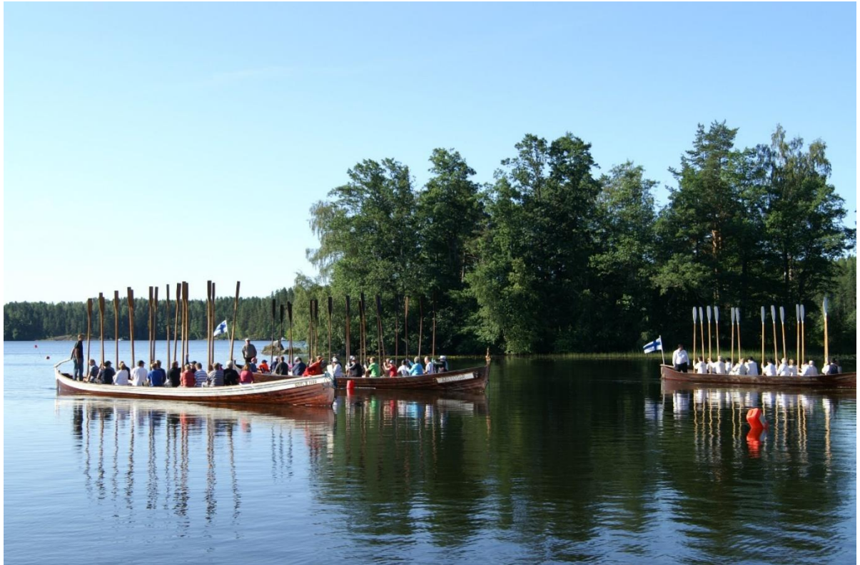
Kirkkovenet Ahti II, Aallotar ja Kukkian Kulkuri saapuvat uimarantaan Kirkastussunnuntaina.